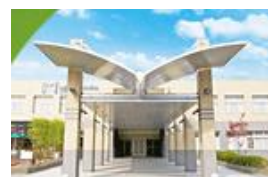
会場 メイワサンピア