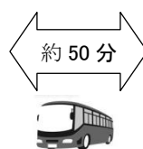
貸切マイクロバス