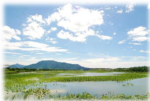
近接の佐潟より角田山を望む