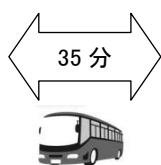
空港リムジンバス