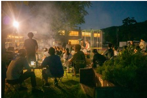
小野川温泉・宝寿の湯