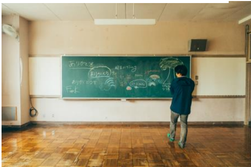
米沢みさわ小学校