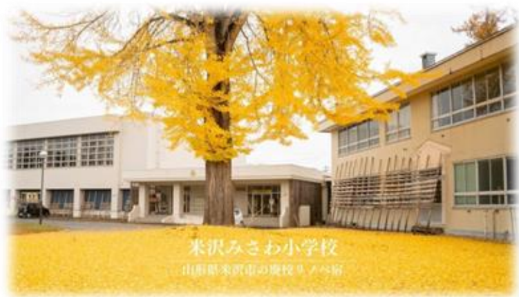
米沢みさお小学校 山形県米沢市の慶校リノ公室